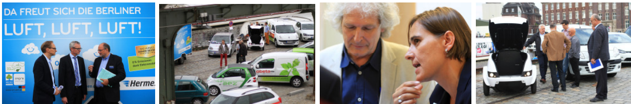
Fotos: Moabiter Energietag 2015 im Westhafen

Geplant ist die Durchführung einer Tombola und die Vergabe eines „Moabiter Solar-Cups“: ferngesteuerte Modell-Solar-Autos werden durch einen Parcours gelenkt und für die Spitzenplätze Preise ausgelobt.