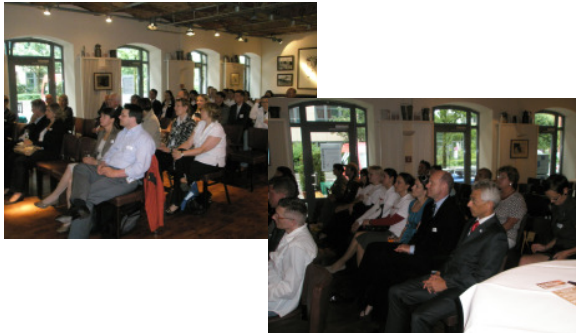
Informations- und Diskussionsforum