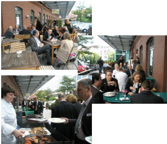
„Essen und Trinken hält Leib und Seele zusammen“