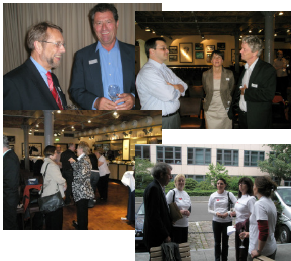
„Kommunikation: miteinander reden“