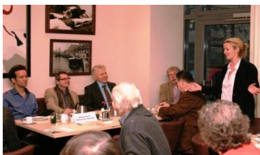
Gelungener Jahresauftakt beim Unternehmerfrühstück im Abion Hotel

Am 8. Januar hatte das Netzwerk Moabit zum ersten Unternehmerfrühstück des Jahres 2013 eingeladen. Treffpunkt war diesmal das Abion Hotel , das gemütliche Atmosphäre und ein reichhaltiges Frühstücksbuffet zu bieten hatte.