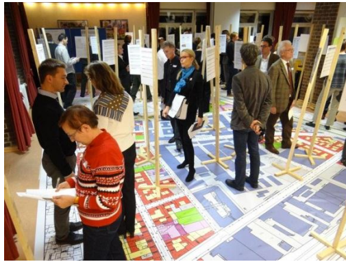
Markierte Fläche des Gebiets „Moabit West“ (links) und Impression des zweiten Werkstattgesprächs im November 2012