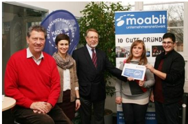
Jugendliche und Vorstandsmitglieder des Netzwerks Moabit bei der Vorstellung des Ausbildungsreaders 2013/2014

Für die Zukunftsfähigkeit einer Region bzw. einer Gesellschaft ist es entscheidend, jungen Menschen eine Berufsausbildung zu ermöglichen. Daher stellt das Thema Bildung und Ausbildung einen wichtigen Aspekt unserer Netzwerkarbeit dar.