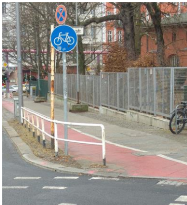
Blick aufs Detail: ein in den Radweg ragendes Fußgängerschutzgitter an der Kreuzung Gotzkowskystraße/Levetzowstraße

Im Auftrag des Bezirks Mitte erforscht das an der TU Berlin angesiedelte Projekt „MoabitRad“ derzeit, inwieweit in Moabit West stattfindende Verkehre auf das Fahrrad verlagert werden können und welche Hürden hierbei zu überwinden sind. Im Ergebnis wird das Projekt Maßnahmen zur kurzfristigen Umsetzung vorschlagen.