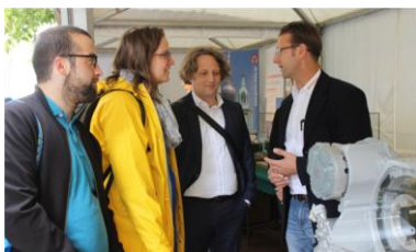
Schnappschuss vom Moabiter Energietag 2017 vor dem Rathaus Tiergarten

Auch in diesem Jahr wird es wieder einen Moabiter Energietag geben, und das Konzept der nunmehr siebten Ausgabe nimmt langsam Gestalt an. Derzeit prüfen wir, ob die Veranstaltung in Kooperation mit dem Geschäftsstraßenmanagement Turmstraße am 1. September – und damit im Rahmen des Moabiter Kiezfestes – stattfindet oder aber separat am 6. September vor dem Rathaus Tiergarten. Wir halten Sie auf dem