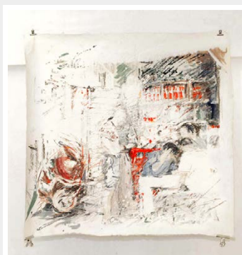
Marion Ehrsam „Die Spielenden“ / 2018

aus der Serie ‚Szenenbilder‘ Gouache/Kreide auf Reispapier/Gaze ca. 120 x 130cm