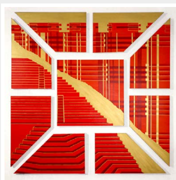
Eileen F. Almarales Noy „N. 3 Ingenieros de Almas“ / 2023