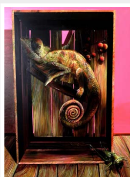
Young-Sik Lee „Die Ästhetik des Schreckens“ / 2009